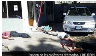
Imagen de los cadáveres tiroteados.

Almeno quindici giovani sono stati uccisi da un commando armato in un autolavaggio nel municipio di Tepic, nello stato messicano di Nayarit, nell'ovest del Paese, una delle zone utilizzate dai narcos per far transitare la droga verso gli Usa.